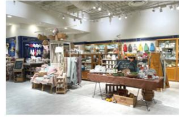
キャトル・セゾン 大阪