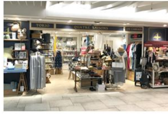
キャトル・セゾン 横浜