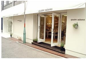
キャトル・セゾン トキオ

キャトル・セゾンは、創業以来、「自然を感じながら豊かに住まうパリの暮らし」をテーマに、「地域の生活者の日々の暮らしを豊かな喜びで満たす」ことを基本理念としています。そして、成熟した生活者に向けて、より質の高い生活文化と、新しい家族の暮らしを提案したいと願っています。