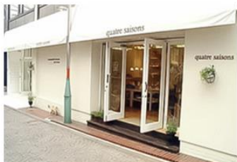
キャトル・セゾン トキオ

キャトル・セゾンは、創業以来、「自然を感じながら豊かに住まうパリの暮らし」をテーマに、「地域の生活者の日々の暮らしを豊かな喜びで満たす」ことを基本理念としています。そして、成熟した生活者に向けて、より質の高い生活文化と、新しい家族の暮らしを提案したいと願っています。