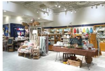
キャトル・セゾン 大阪