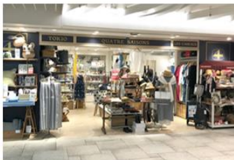
キャトル・セゾン 横浜