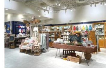
キャトル・セゾン 大阪