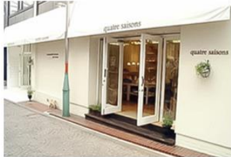
キャトル・セゾン トキオ

キャトル・セゾンは、創業以来、「自然を感じながら豊かに住まうパリの暮らし」をテーマに、「地域の生活者の日々の暮らしを豊かな喜びで満たす」ことを基本理念としています。そして、成熟した生活者に向けて、より質の高い生活文化と、新しい家族の暮らしを提案したいと願っています。