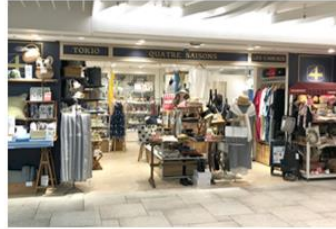
キャトル・セゾン 横浜