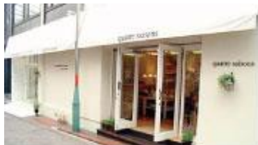
キャトル・セゾン・トキオ

キャトル・セゾンは、創業以来、「自然を感じながら豊かに住まうパリの暮らし」をテーマに、「地域の生活者の日々の暮らしを豊かな喜びで満たす」ことを基本理念としています。そして、成熟した生活者に向けて、より質の高い生活文化と、新しい家族の暮らしを提案したいと願っています。