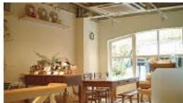
カフェ・キャトル (神戸)