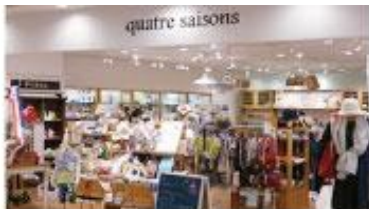
キャトル・セゾン なんば