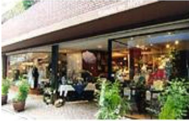
キーショップ 自由が丘店