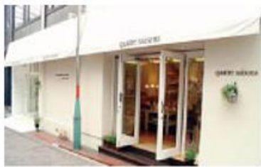
キャトル・セゾン・トキオ

キャトル・セゾンは、創業以来、「自然を感じながら豊かに住まうパリの暮らし」をテーマに、「地域の生活者の日々の暮らしを豊かな喜びで満たす」ことを基本理念としています。そして、成熟した生活者に向けて、より質の高い生活文化と、新しい家族の暮らしを提案したいと願っています。