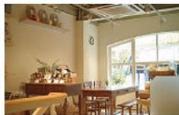
カフェ・キャトル (神戸)