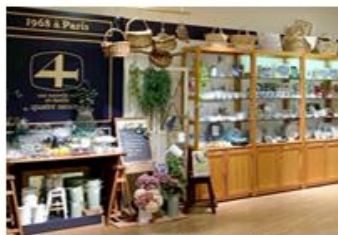
キャトル・セゾン 大阪