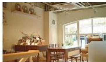
カフェ・キャトル (神戸)