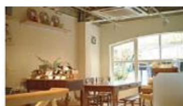
カフェ・キャトル(神戸)