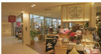
キャトル・セゾン・テラス