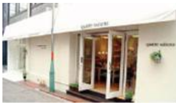
キャトル・セゾン・トキオ

キャトル・セゾンは、創業以来、「自然を感じながら豊かに住まうパリの暮らし」をテーマに、「地域の生活者の日々の暮らしを豊かな喜びで満たす」ことを基本理念としています。そして、成熟した生活者に向けて、より質の高い生活文化と、新しい家族の暮らしを提案したいと願っています。