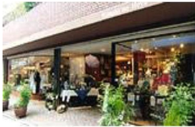
キーショップ 自由が丘店